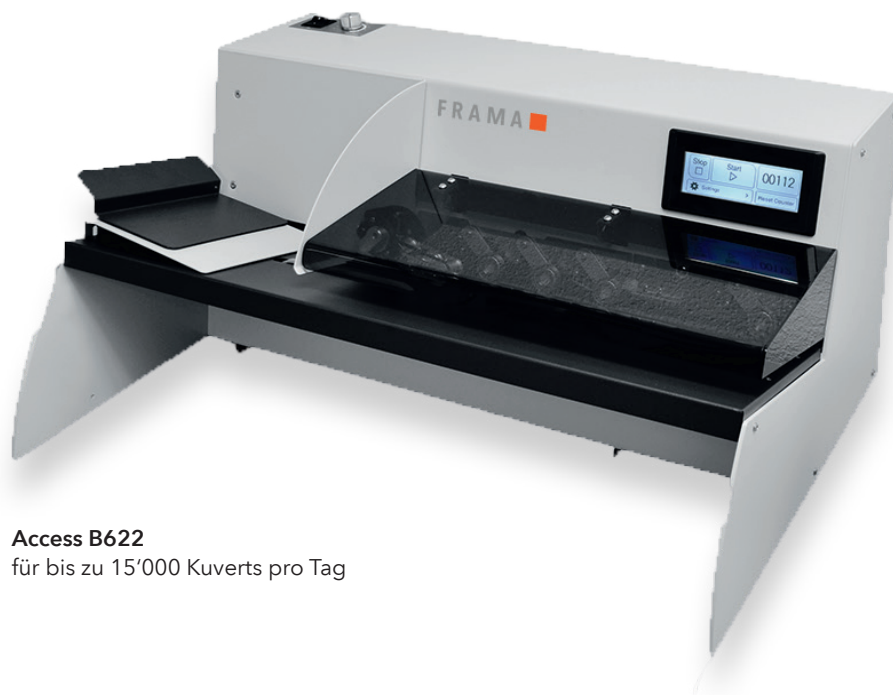
Access B622 für bis zu 15'000 Kuverts pro Tag

werden die Briefe sauber getrennt vom Anlagestapel abgezogen und dem Fräsbereich des Geräts zugeführt. Ein praktisches Zählwerk sorgt zudem für eine tägliche Posteingangsstatistik.