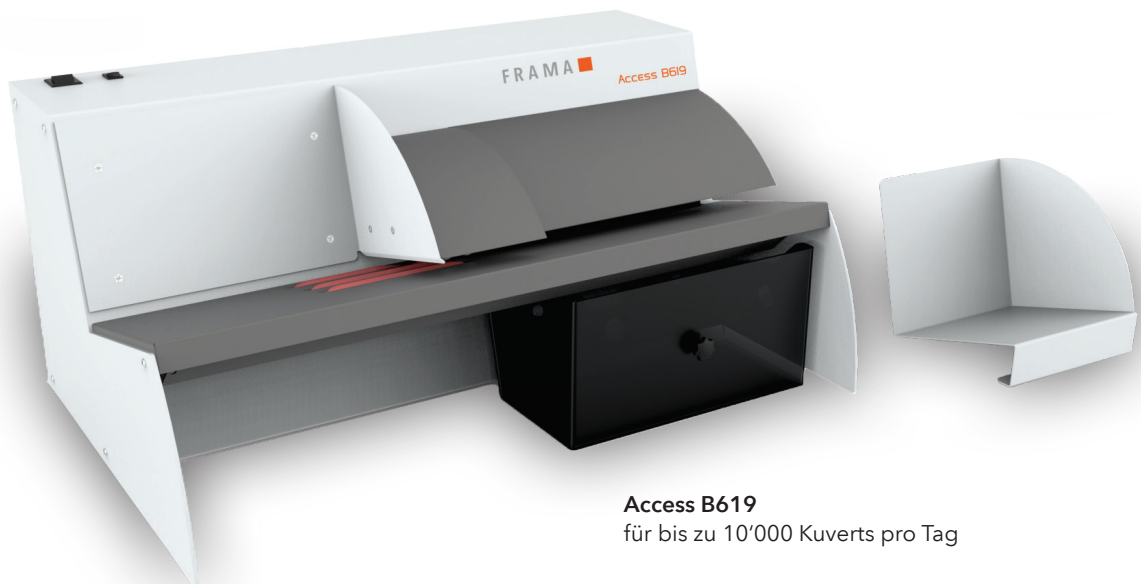
Access B619 für bis zu 10'000 Kuverts pro Tag

einfach. Dank der einzigartigen Technik, Briefe zu fräsen statt aufzuschneiden, riskieren Sie keine beschädigten Briefinhalte. Der anfallende Fräsabfall wird in einem integrierten, abnehmbaren Abfallbehälter gesammelt.