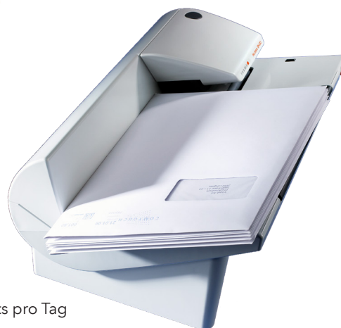
Access B400 für 50 bis 400 Kuverts pro Tag