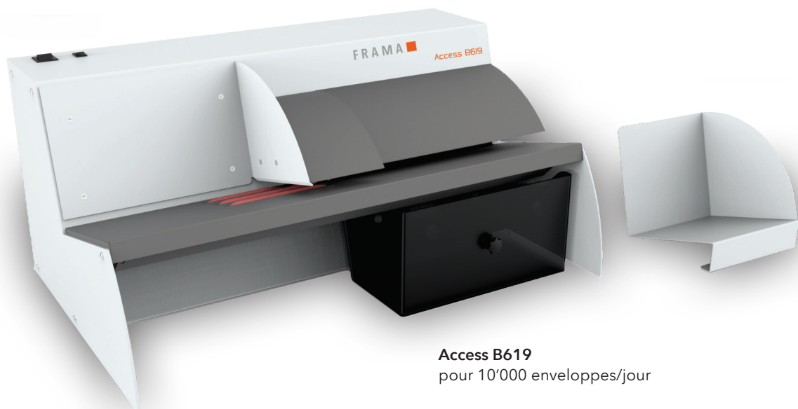
Access B619 pour 10'000 enveloppes/jour

6 mm. Grâce à la technologie unique qui consiste à fraiser les lettres au lieu de les découper, il n'y a aucun risque d'endommager leur contenu. Les déchets de broyage sont collectés dans un conteneur à déchets intégré et amovible.