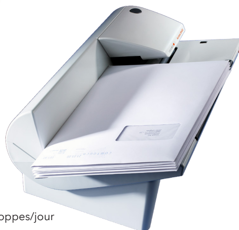
Access B400 pour 50 à 400 enveloppes/jour