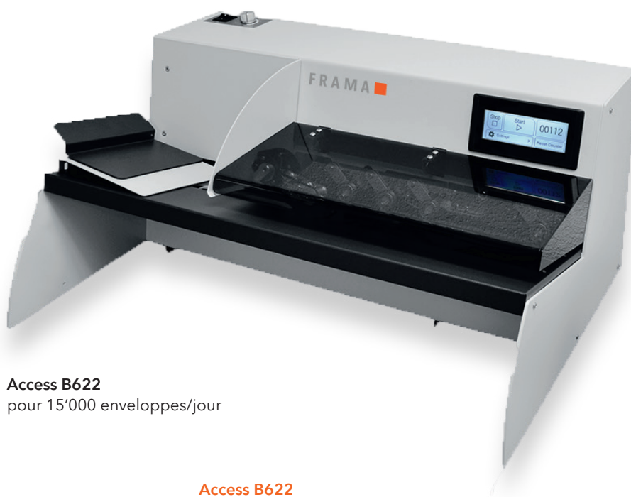
Access B622 pour 15'000 enveloppes/jour

un système de séparation, les lettres sont soigneusement séparées de la pile d'alimentation et acheminées vers la zone de fraisage de la machine. Un compteur pratique fournit également des statistiques quotidiennes sur le courrier entrant.